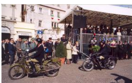
Scorta in moto a Trento